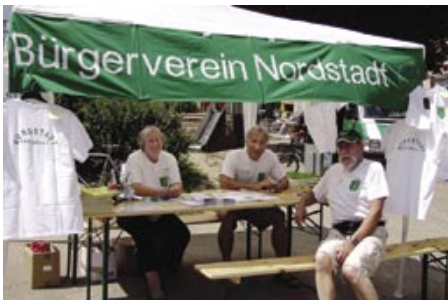
Zweimal Bürgerverein: Hier 2018 beim Stadtteitag und ...

Neben der baulichen Entwicklung hat sich in den 30 Jahren ihres Bestehens in