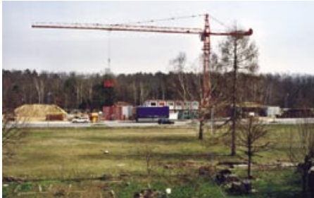
Neu angelegte Ohiostraße mit erster Baustelle (ca. 2000)

ein Hotel, diverse Bürogebäude, Einkaufsmöglichkeiten, die berufsbildende Carlo-Schmid-Schule sowie ein freikirchliches Gemeindezentrum mit Kirche realisiert.