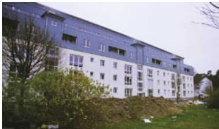
Aufstockung der Reihenhäuser

Die Hardtwaldsiedlung entstand bereits ab 1919 als genossenschaftlich geprägtes Wohngebiet mit Gärten, Läden und einem ausgeprägten Nachbarschaftsgedanken, während die „Ami-Siedlung“ ab 1950 als Wohnort für US-Soldaten und ihre Familien mit eigener Infrastruktur ausgebaut wurde.