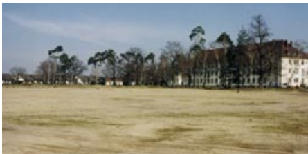
1998: Im Vordergrund wird Smiley West entstehen, aus der Kaserne im Hintergrund ist die MiKa geworden

Betriebe und Dienstleistungen siedelten sich an. Auch das KSC-Fanprojekt und ein Kulturverein fanden hier eine befristete Heimat. Ein US-Gästehaus diente zeitweise als Unterkunft für Flüchtlinge. In der Poliklinik kamen u.a. eine Arztpraxis sowie ein Tanzstudio unter. 1999 wurde die FASKA (Freie Aktive Schule Karlsruhe e.V.) zunächst als Grundschule mit angegliedertem Freien Aktiven Kindergarten eröffnet. Einige Gebäude fielen allerdings der Abrissbirne zum Opfer, so das Filmtheater „Minute Man“, die Bowlinghalle, der Offiziersclub an der Michiganstraße und der Tower am Alten Flugplatz.