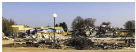
Abriss auf dem C-Areal

Der Alte Flugplatz, für den zunächst Bebauungsabsichten bestanden, wurde aufgrund seiner einzigartigen Sand- und Magerrasen sowie Blühstandorte als Lebensraum für zahlreiche Vogel- und Falterarten 2010 als Naturschutzgebiet ausgewiesen. Nach dem Verkauf des so genannten C-Areals westlich der Erzbergerstraße an einen Investor 2014 wurde ein Bebauungsplan für das Entwicklungsquartier „Zukunft Nord“ entwickelt. Er sieht neben dem Fortbestand des NCO-Clubs eine gemischte Nutzung mit Wohngebieten, Gewerbe und Gemeinbedarfsflächen vor. Nach dem Auszug der Mieter und einer großartigen Street-Art-Ausstellung im Oktober 2021 begann der Abriss der Gebäude, der nun mit dem Einkaufsmarkt