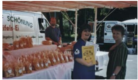
... schon 1998 bei der Verteilung der Nordstadtzeitung

abgeschlossen werden soll (und irgendwann startet hoffentlich auch die Bebauung). Die Stadt hat 2025 für in ihrem Besitz befindliche Grundstücke im Süden des Gebiets ein Konzeptvergabeverfahren für gemeinwohlorientierte Baugruppen ausgeschrieben. Gemeinsam mit der Stadt sollen nun ausgewählte Gruppen ihre Konzepte weiterentwickeln.