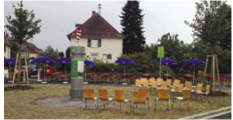
Einweihung des Ikarusplatzes in der Hardtwaldsiedlung

waldzentrum, eine Gesundheits- und Begegnungsstätte samt Kita umgebaut.