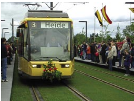
Eröffnung der Linie 3 „Heide“

Am 27. Mai 2006 wurden die Nordstadt und Neureut-Heide an das Straßenbahnnetz angeschlossen. Zuvor hatte es einen langwierigen Abstimmungsprozess mit zeitweise leidenschaftlich geführtem Meinungsaustausch zwischen Befürwortern und Gegnern gegeben.