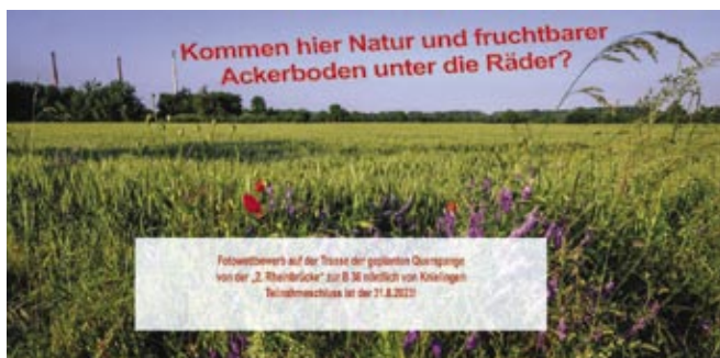
Foto-Enthusiast*innen, Naturliebhaber*innen, Spaziergänger*innen, Menschen mit einem Blick für das Besondere sind aufgerufen, die Schönheit und Einzigartigkeit

der Natur in all ihrer Vielfalt fotografisch festzuhalten. Zeigen Sie auf bis zu drei Fotos, was verloren geht, wenn die Querspange gebaut werden sollte. Einsendungen bitte bis zum 31.8.2023. Es winken Preise von 250 Euro (1. Preis), 150 Euro (2. Preis) und 100 Euro (3. Preis), die im Oktober 2023 durch eine Jury vergeben werden.