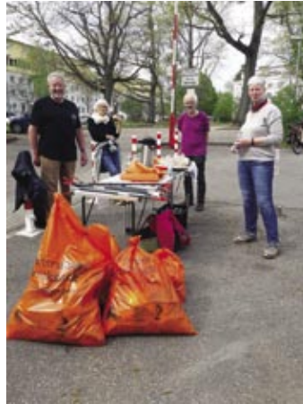
Kleine Pause, Stärkung und Klönen bei der Putzete 2023

Am 22. April hatte der Bürgerverein zur traditionellen Putzete im Stadtteil als Beteiligung an den Dreck-weg-Wochen aufgerufen. Das Wetter war frühlingshaft sonnig, perfekte Voraussetzungen also. Wegen der noch nicht verteilten Nordstadt-Zeitung kam nur ein kleines Häuflein Putzwütiger zusammen, sieben Menschen. Zufrieden waren dennoch alle, ein paar Müllsäcke weniger verteilter Abfall im Stadtteil zählen schließlich auch. Wie gedankenlos Umverpackungen und unzählige Zigarettenkippen fallen gelassen werden, stößt dabei auf.