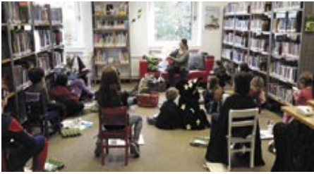
Stories for Kids Ages 6 & Up